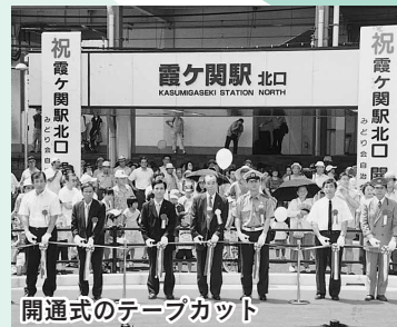
開通式のテープカット

7月15日、霞ヶ関駅北口が開通しました。駅前広場には、市内で初めて送迎用駐車場を整備。北口と南口を24時間行き来できる自由通路も、同時に開通しました。式典は、500人以上の市民の皆さんが参加。式典の前後には、地域の皆さんによる獅子舞や鯨井の万作などが披露され、北口の開通を祝っていました。