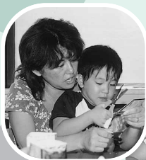
お母さん、ボクが切るよ！