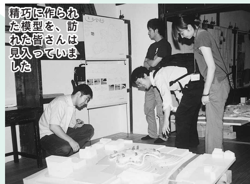
精巧に作られた模型を、訪れた皆さんは見入っていました

川越の歴史や文化を生かしたまちづくりのモデルを、東洋大学工学部の学生が提案する「まちかど講評会」。7月16日と17日に、本町の長屋(元町1丁目)で行われました。今回のテーマは、濯紫公園を敷地とした「川辺の川越まちづくりライブラリー」。180点のモデルの中から選ばれた、16点が並びました。学生の皆さんの自由な発想が、これからの川越を考えるきっかけになりそうです。