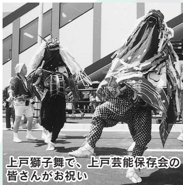
上戸獅子舞で、上戸芸能保存会の皆さんがお祝い