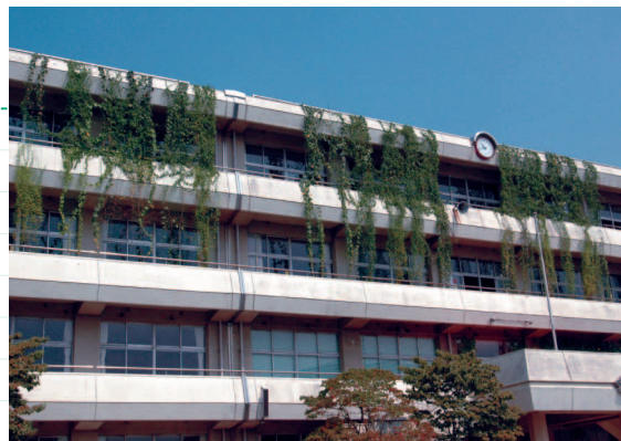
校庭から校舎を見ると、成長した植物が緑のカーテンになっています