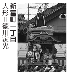
新富町一丁目 人形 徳川家光