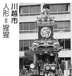
川越市 人形 猩猩