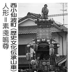
西小仙波町(歴史文化伝承山車) 人形 素戔嗚尊