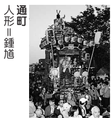
通町 人形 鍾馗