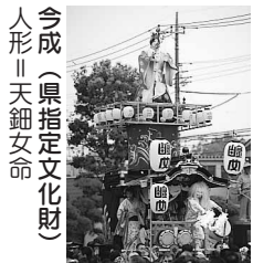
今成(県指定文化財) 人形 天鈿女命