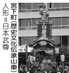
宮下町(歴史文化伝承山車) 人形 日本武尊