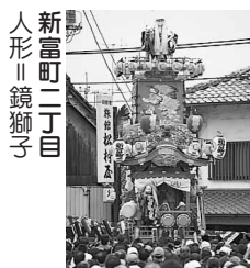
新富町二丁目 人形 鏡獅子