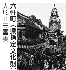
六軒町(県指定文化財) 人形 三番叟