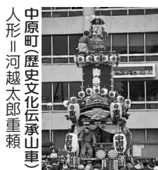
中原町(歴史文化伝承山車) 人形 河越太郎重頼