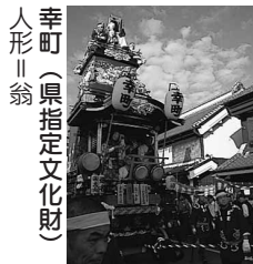
幸町(県指定文化財) 人形 翁