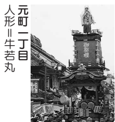
元町一丁目 人形 牛若丸