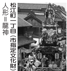
松江町一丁目(市指定文化財) 人形 龍神