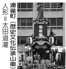
連雀町(歴史文化伝承山車) 人形 太田道灌