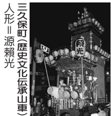
三久保町(歴史文化伝承山車) 人形 源頼光