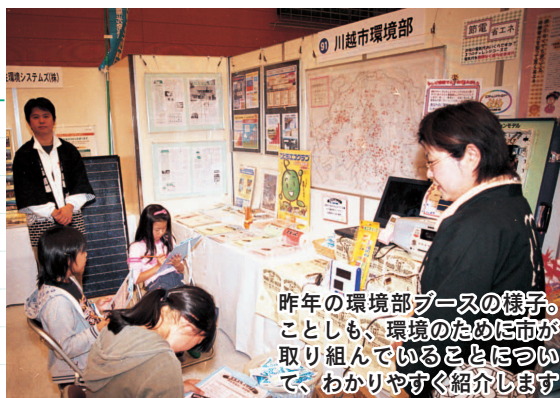
昨年環境部ブースの様子。ことしも、環境のために市が取り組んでいることについて、わかりやすく紹介します

テレビなどでご存じの方も多いと思いますが、先日、川越にオットセイが迷い込んで来ました。保護されたときは衰弱していましたが、現在は上野動物園で順調に回復中。その後のオットセイを、広報川越でお知らせしようと考えています▶いよいよ川越ナンバーがスタートしました。この広報が市民の皆さんに届くころには、川越ナンバーを付けた車が走っているはず。しばらくの間は、道行く車のナンバーが気になりそうです▶7月に行われた百万灯夏まつり。その様子を広報で掲載したところ、写真を見た市民の方から「よかったよ」とお褒めのことばをいただきました。広報担当として、最もうれしい瞬間の1つです。今度の週末は川越まつり。市民の皆さんに喜んでいただけるよう、これからもカメラを片手に駆け回ります。