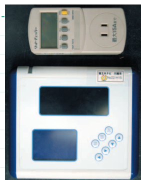
会場では、省エネナビと簡易電力計の実物を見ることが出来ます