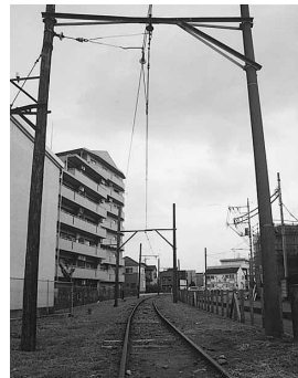
今にも列車がやって来そうな安比奈線の線路。旅客化の推進をしていきます

今後、第三次川越市総合計画では、既存の路線については複々線化や複線化など、輸送力の増強などを促進していきます。また、休止扱いとなっている西武安比奈線の旅客化の推進をしていきます。光が丘から先の延伸が計画されている都営大江戸線についても、動向を見きわめながら、市内への延伸を促進していきます。市民の皆さんの重要な交通手段として活躍する鉄道。川越に初めての鉄道が開通したとき、ここまで便利になるとはだれも思わなかったのでは？ 将来、計画が実現し、鉄道網が広がると、市民の皆さんの鉄道による行動範囲が広がり、市内を訪れる観光客の増加にもつながると考えられます。