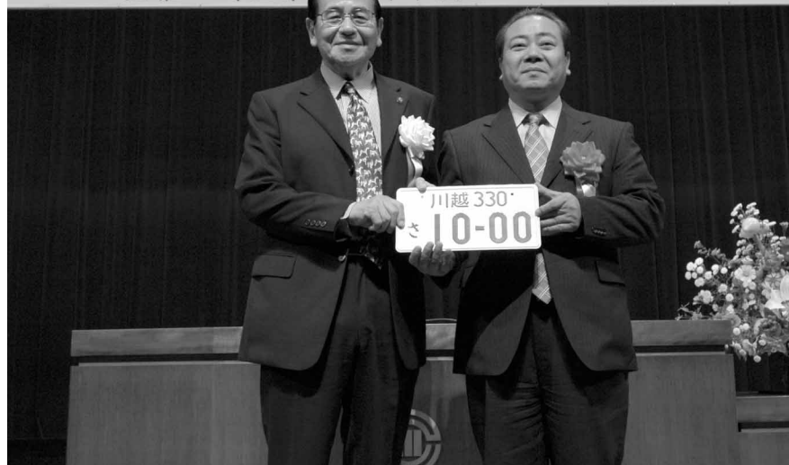
本澤支局長から川越ナンバーを手渡される舟橋市長