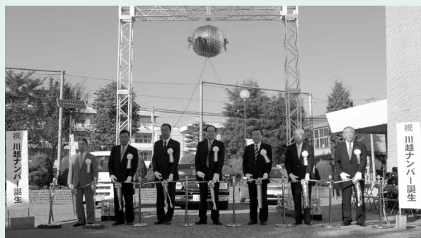
レインボー協議会を構成する7市町の首長によって、テープカットが行われました