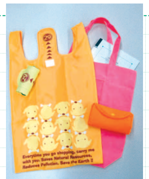
折りたたみバッグは、小さくなって携帯に便利