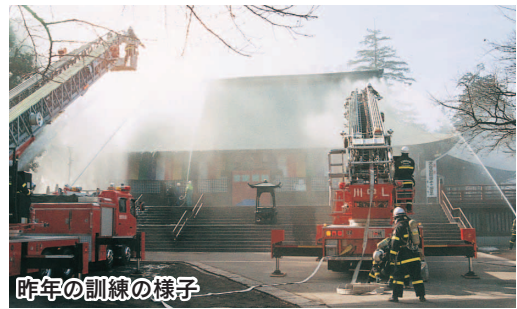
昨年の訓練の様子