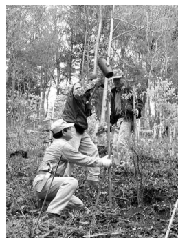
ミツバツツジを植樹するボランティアの皆さん

募り始めました。同十年までの間で取得した土地を「日高市環境保全条例」に基づき、「ふるさと森」第一号地に指定。さらに、同十五年には国から保安林として指定を受けました。こうした取り組みによって、日和田山の緑を守る環境が徐々に整ってきました。