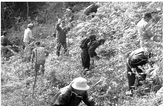
環境ボランティアの皆さんによる山の手入れ

しかし、人の手が入らなくなつてからは荒れ果ててしまいました。また、ゴルフ場や住宅の開発の話もありました。そこで市は、まず平成四年に、市民の財産として残せるように、日和田山の土地の取得を始めました。そして、同年に「日高市緑の基金」を創設し、皆さんから日和田山の土地取得や市内の緑を保全するための寄付を