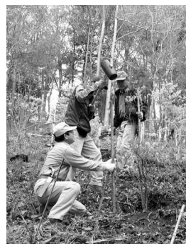
ミツバツツジを植樹するボランティアの皆さん

募り始めました。同十年までの間で取得した土地を「日高市環境保全条例」に基づき、「ふるさと森」第一号地に指定。さらに、同十五年には国から保安林として指定を受けました。こうした取り組みによって、日和田山の緑を守る環境が徐々に整ってきました。