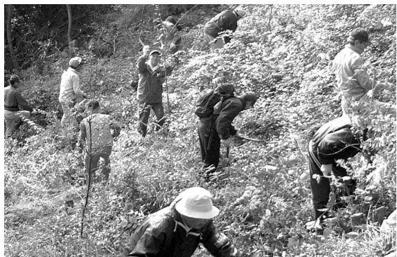
環境ボランティアの皆さんによる山の手入れ

しかし、人の手が入らなくなつてからは荒れ果ててしまいました。また、ゴルフ場や住宅の開発の話もありました。そこで市は、まず平成四年に、市民の財産として残せるように、日和田山の土地の取得を始めました。そして、同年に「日高市緑の基金」を創設し、皆さんから日和田山の土地取得や市内の緑を保全するための寄付を