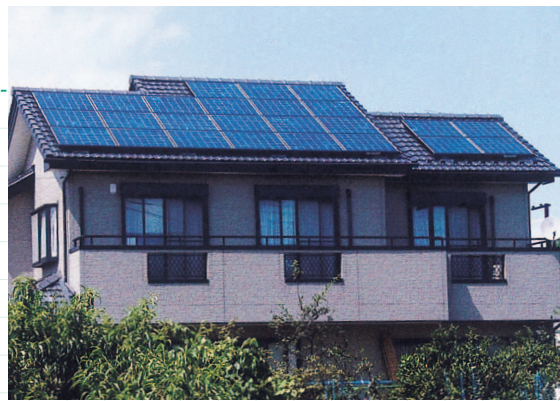
市は、のべ827件の太陽光発電システム設置に補助を行いました