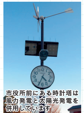
市役所前にある時計塔は風力発電と太陽光発電を併用しています