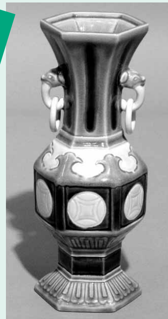
永楽善五郎作 柄杓立 えいらくぜん ごろう ひしゃくたて 口径6cm・高さ19.5cm