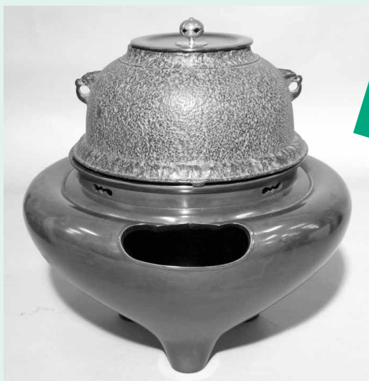
千家十職の釜師・大西清右衛門作 おおにしせい えもん 風炉釜添 直径32cm・高さ33.3cm