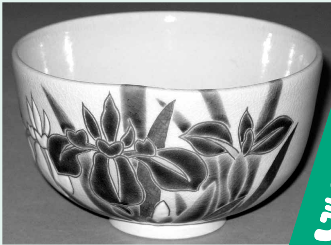
千家十職の焼物師・永楽善五郎作 やきもの えいらくぜん ごろう 茶碗 口径13cm・高さ7cm