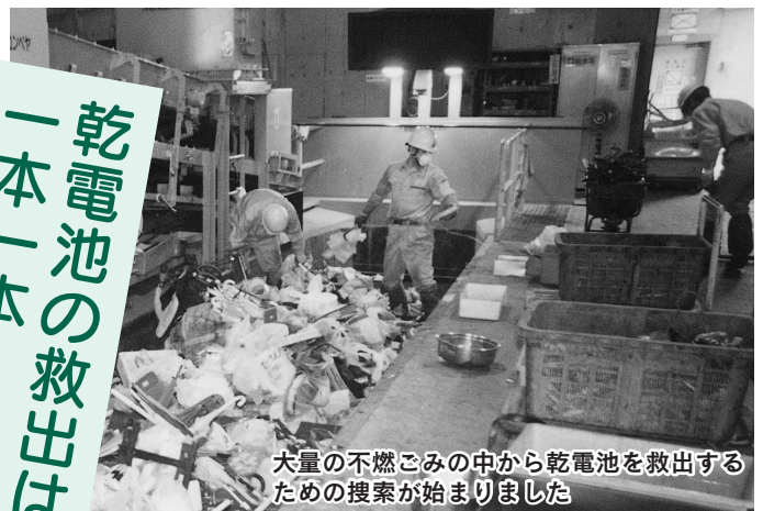
大量の不燃ごみの中から乾電池を救出するための捜索が始まりました