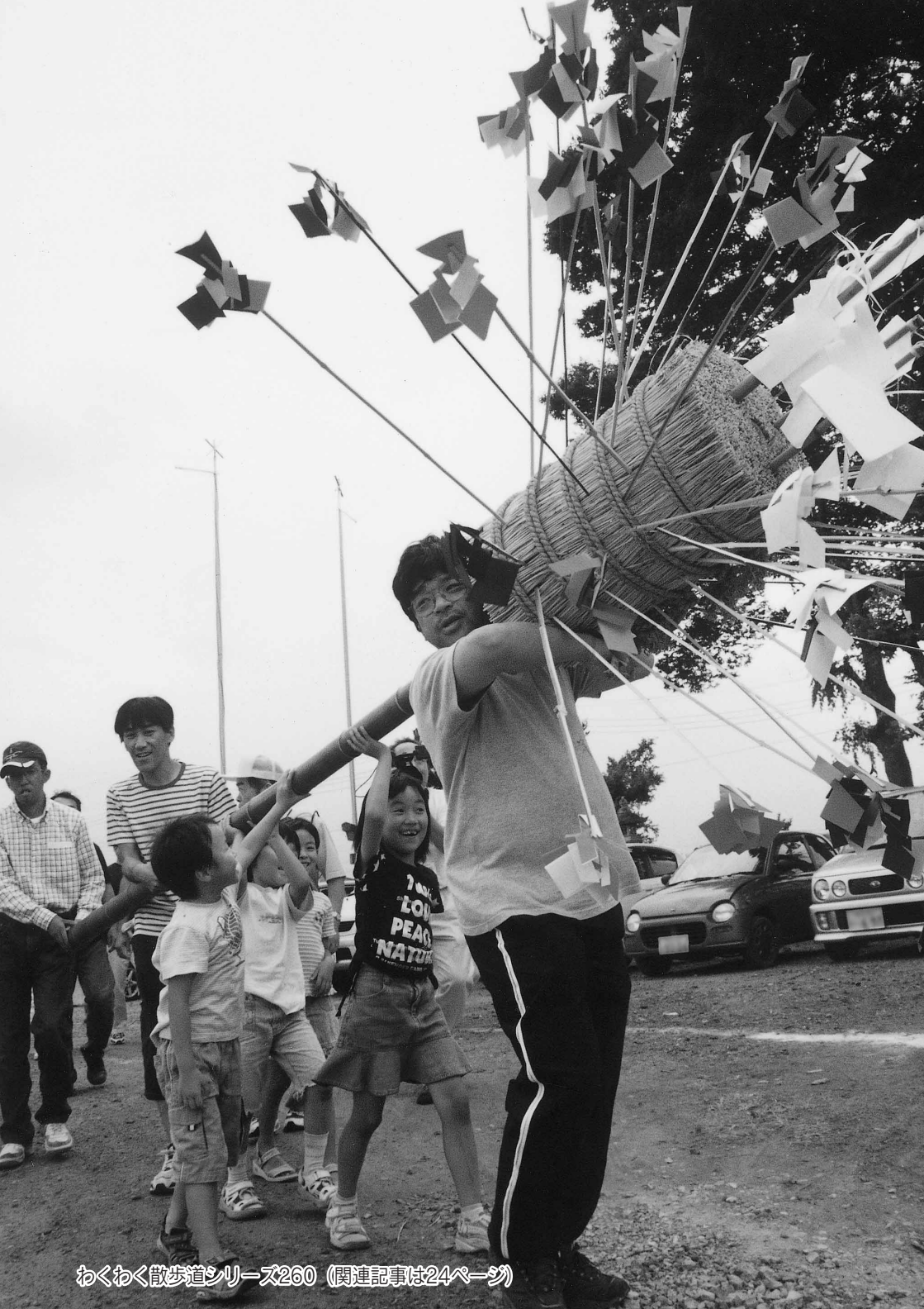
わくわく散歩道シリーズ260 (関連記事は24ページ)