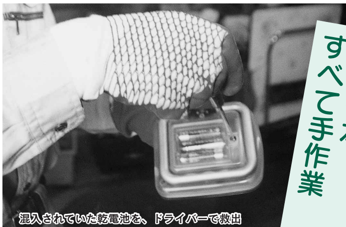
混入されていた乾電池を、ドライバーで救出