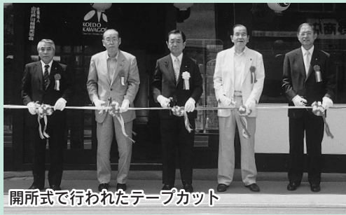
開所式で行われたテープカット

7月28日、(社)小江戸川越観光協会の事務所が、札の辻交差点近くに移転しました。