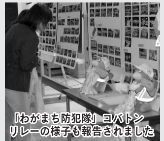
『わがまち防犯隊』ヨバトンリレーの様子も報告されました

活動事例発表と「みんなでつくろう 小江戸川越 防犯のまち」を合言葉とした大会宣言が行われました。地域安全活動のリーダーとして、地域の皆さんと共に、市・警察・事業所など関係機関