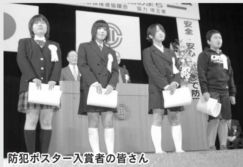
防犯ポスター入賞者の皆さん