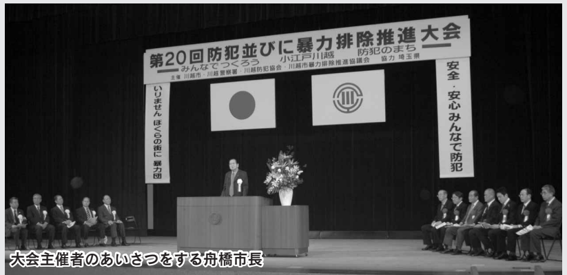
大会主催者のあいさつをする舟橋市長