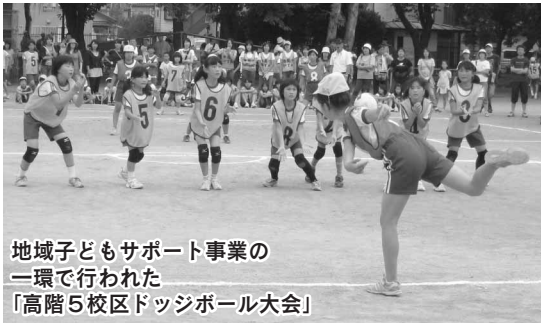
地域子どもサポート事業の 一環で行われた 「高階5校区ドッジボール大会」

10月22日、東海大学校友会館（千代田区）で、高階南公民館が文部科学大臣から優良公民館表彰を受けました。この表彰は、地方における社会教育と文化の向上などに顕著な実績のあった公民館が受けるものです。今回は、全国で56の公民館が表彰されました。