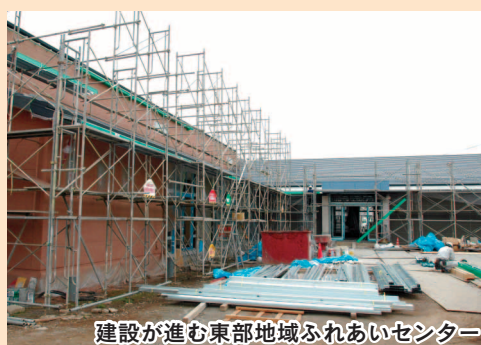
建設が進む東部地域ふれあいセンター

新年に際して、市民の皆様のご健勝とご多幸を心から祈念申し上げます。結びとさせていただきます。