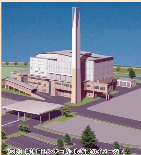
（仮称）新清掃センター熱回収施設のイメージ図

これまで懸案となっておりました（仮称）新清掃センター建設事業は、昨年二月に熱回収施設（ごみ焼却施設）、