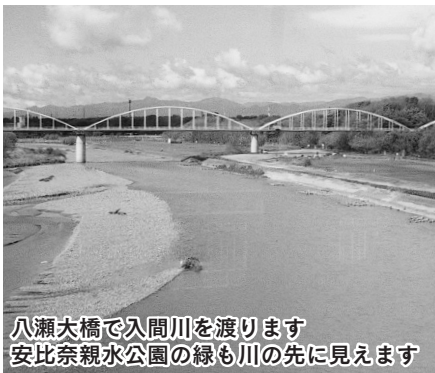
八瀬大橋で入間川を渡ります 安比奈親水公園の緑も川の見えます