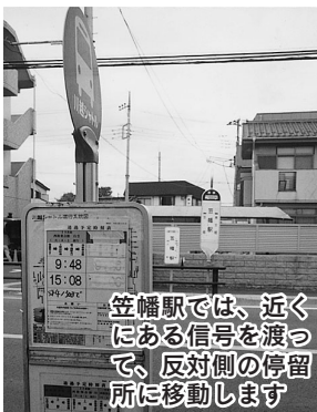
笠幡駅では、近くにある信号を渡って、反対側の停留所に移動します

五月一日、市内循環バス「川越シャトル」の運行時刻が一部変更されました。四月十日発行の広報川越といっしょにお配りした、「市内循環バス『川越シャトル』ダイヤの一部改正のお知らせ」は、ご覧になりましたか？ この企画記事では、川越シャトルの小さな旅を提案します。