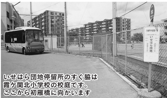
いせはら団地停留所のすぐ脇は霞ヶ関北小学校の校庭です。ここから初雁橋に向かいます