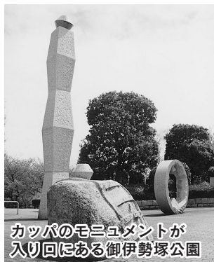
カップパのモニュメントが入り回にある御伊勢塚公園