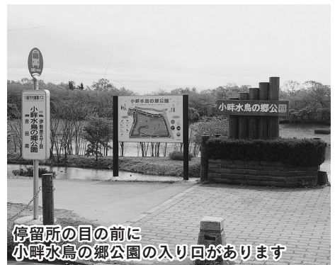
停留所の目の前に小畔水鳥の郷公園の入り回があります

からおおよそ二十五分で、小畔水鳥の郷公園に到着です。 いせはら団地停留所まで散策 川越シャトルを降りると、目の前が公園です。ここから次の川越シャトルに乗る、いせはら団地停留所まで散策を楽しみます。(周辺拡大図②) カモノなどが羽を休める池が広がる小畔水鳥の郷公園から、御伊勢塚を渡った所にあるのが、御伊勢塚公園です。 御伊勢塚公園から、おいせ橋通りをしばらく進むと、西図書館・伊勢原公民館があります。福祉喫茶も併設されているので、一休みもできます。 隣接する霞ヶ関北小学校の建物に沿って進むと信号があり、右に曲がると、いせはら団地の停留所です。 いせはら団地から初雁橋 ここから今度は十一系統に乗車します。初雁橋・霞ヶ関駅南口・小畔水鳥の郷公園を経て、いせはら団地に戻ってくる路線です。 おおよそ十分、左側に菜の花が見えると、初雁橋停留所に到着です。歩いて、次の目的地、西川越駅に向かいます。(周辺拡大図③)