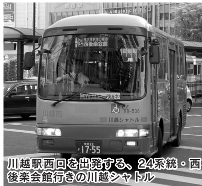
川越駅西回を出発する、24系統・西後楽会館行きの川越シャトル

五月一日、市内循環バス「川越シャトル」の運行時刻が一部変更されました。四月十日発行の広報川越といっしょにお配りした、「市内循環バス『川越シャトル』ダイヤの一部改正のお知らせ」は、ご覧になりましたか？ この企画記事では、川越シャトルの小さな旅を提案します。