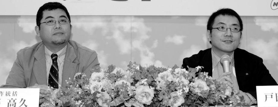
制作統括 後藤 高久