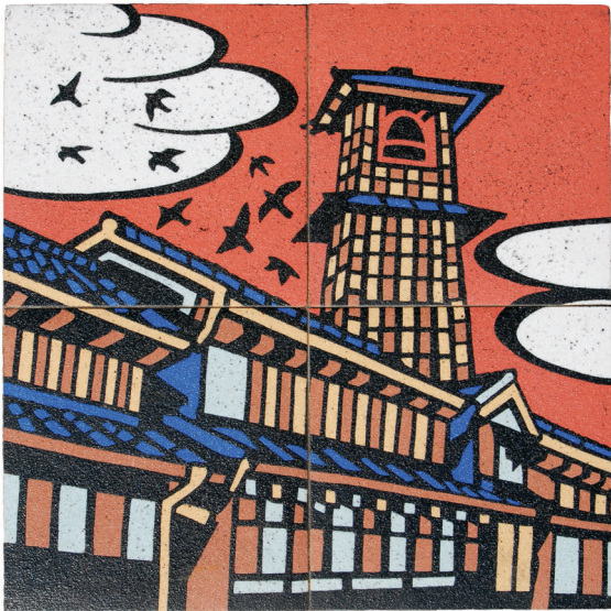
大きさは50センチ四方ほど 色使いが独特です