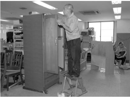
修理して磨きあげれば、まだまだ使えます

粗大ごみの中で、まだ使える家具などは修理をして、金曜日（祝日・休日を除く）の午前九時～午後四時（正午～午後一時を除く）に同センターで、展示販売しています。