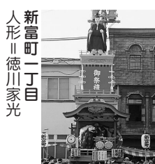
新富町一丁目 人形||徳川家光