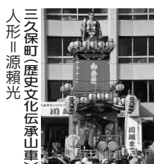
三久保町(歴史文化伝承山車) 人形||源頼光