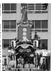
連雀町(歴史文化伝承山車) 人形||太田道灌