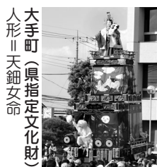
大手町(県指定文化財) 人形||天鈿女命

川越駅前観光案内所・TEL222-5556 川越まつり情報案内・TEL03-5777-8600