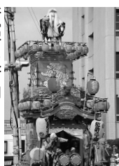
新富町二丁目 人形||鏡獅子