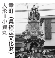
幸町(県指定文化財) 人形||小狐丸