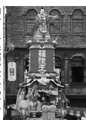
仲町(県指定文化財) 人形||羅陵王