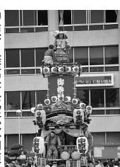
中原町(歴史文化伝承山車) 人形||河越太郎重頼