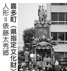
喜多町(県指定文化財) 人形||依藤太秀郷