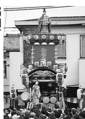
脇田町 人形||徳川家康