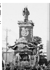
野田五町 人形||八幡太郎