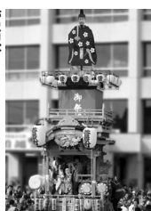
菅原町 人形||菅原道真