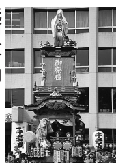
元町一丁目 人形||牛若丸