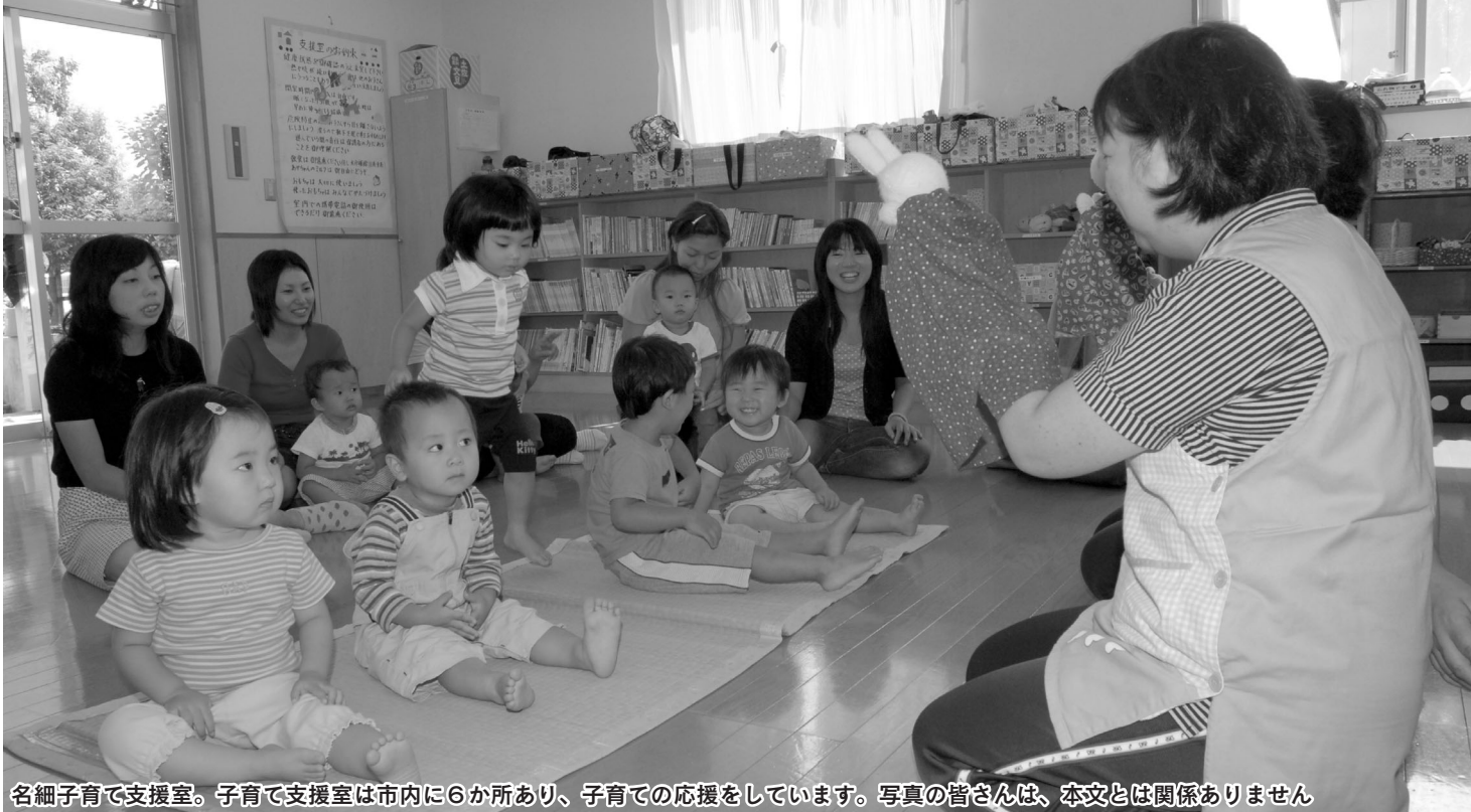
名細子育て支援室。子育て支援室は市内に6か所あり、子育てでの応援をしています。写真の皆さんは、本文とは関係ありません