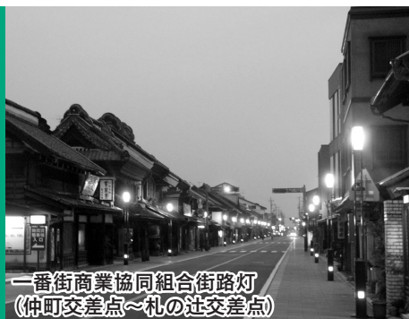
一番街商業協同組合街路灯 (仲町交差点～札の辻交差点)

空間を構成するすべてにバランスが取れ、新しい試みやくふうが盛り込まれていて、景観づくりに対する模範となるもの