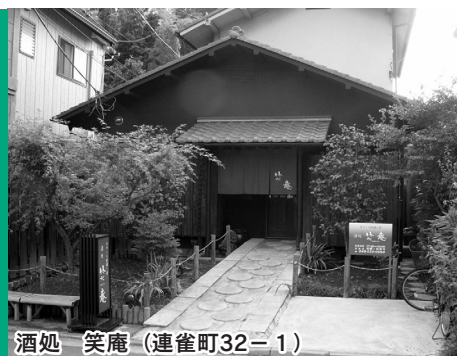
酒処 笑庵 (連雀町32-1)

景観をつくり出す、さまざまな具象的・抽象的要素(ポイント)について模範となるもの