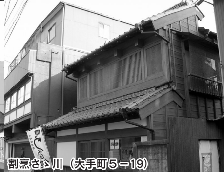
割烹ささ川 (大手町5-19)