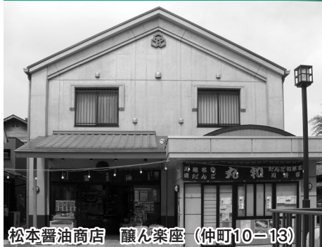
松本醤油商店 醸ん楽座 (仲町10-13)