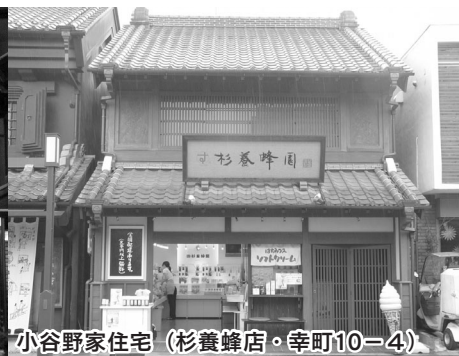
小谷野家住宅 (杉養蜂店・幸町10-4)