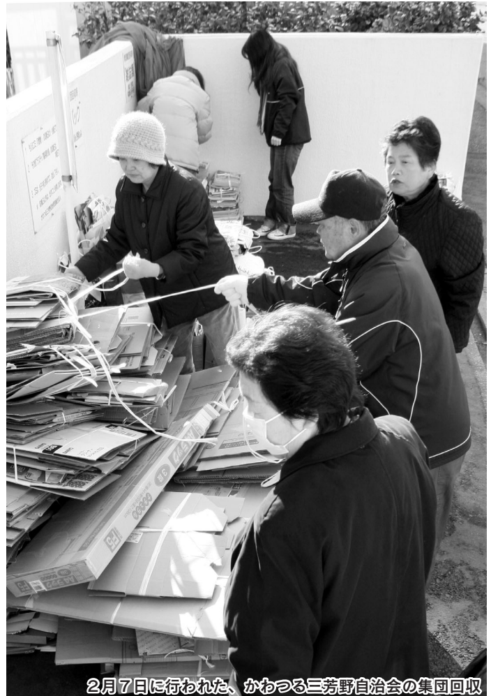
2月7日に行われた、かわつる三芳野自治会の集団回収