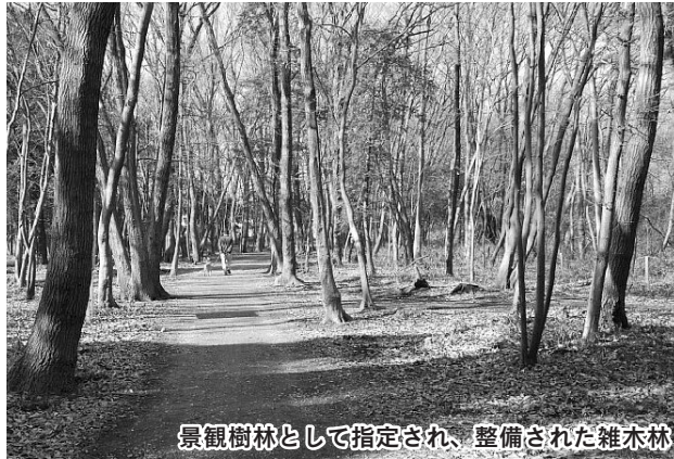
景観樹林として指定され、整備された雑木林

昔から人は、広葉樹を中心とした雑木林を、生活の場の周囲にはぐくんできました。その主な目的は、①落ち葉を集めて、たい肥を作る②雑木をまきや炭にする③きのこや山菜を採るなど、農業や農家の生活を支える役割を果たしてきました。