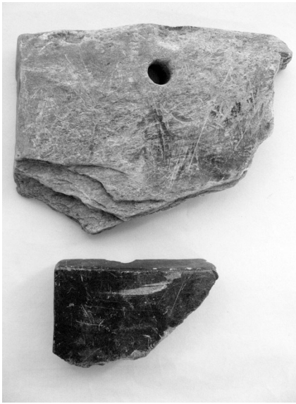
滑石製の温石（上）と石鍋を転用した温石（下）

ちなみに、作業中の僧が寒さと空腹を我慢するため、懐に温石を入れたことが、空腹をしのぐ軽い食事である「懐石料理」の語源だといわれています。