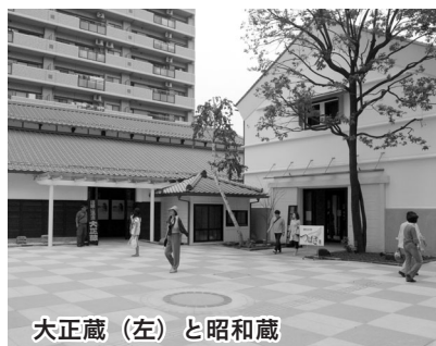
大正蔵（左）と昭和蔵