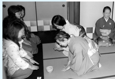
お茶会に250人が訪れました