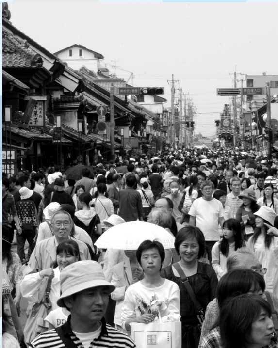
にぎわいを見せた、一番街の歩行者天国

市指定文化財・旧山崎家別邸では、お茶会が開催されました。一番街のにぎわいとは対照的に静かな空間で、お点前が見られる茶席。銘木が使われている和室の雰囲気を楽しみ、抹茶と共に味わっていました。