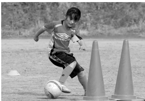
体重移動を素早く行い、相手をかわす練習に熱が入ります