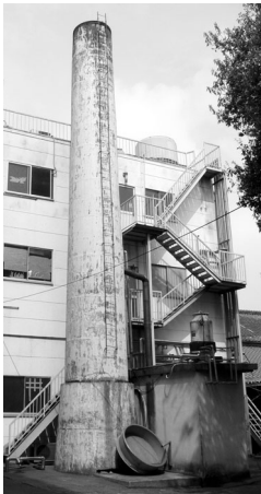
当時の煙突と井戸のあった小屋（煙突の右）

煙突から一メートルほど離れた井戸の跡には、四角いふたが作られています。井戸は六十メートルの深さで、そこからくみ上げていた地下水は、酒造りの命である仕込水としても使われていました。広場南側には、地下水の豊かさを伝えるかのように、せせらぎが造られています。これからの季節、涼を楽しませてくれることでしょう。