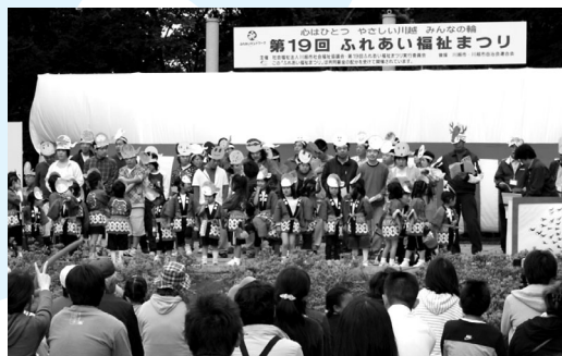
みんなで舞台、楽しい劇のはじまり！

市社会福祉協議会などが主催の「第19回ふれあい福祉まつり」が、5月17日に伊佐沼公園で行われました。同まつりは、年齢や障害の有無にかかわらず、みんなで参加し、肌で感じ、福祉への理解を深めてもらうものです。ステージコーナーでは、視力障害者によるカラオケ・手話の歌・中学生のよさこいなど、広場では、金魚すくいや模擬店などが行われました。会場内は、約33,000人の皆さんで最後までにぎわっていました。