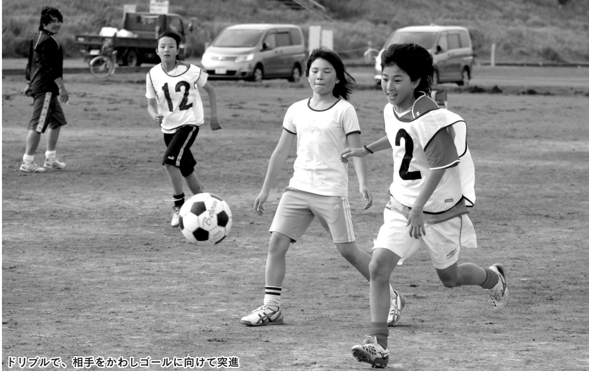
ドリブルで、相手をかわしゴールに向けて突進