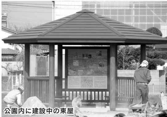
公園内に建設中の東屋

市では同館跡を史跡公園として整備することで、郷土の歴史を学ぶ場や散策・レクリエーションの場を提供し、市内西部の観光の活性化を目指しています。また、茶を利用した事業のほか、各種イベントの開催場所としても活用していく予定です。