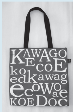
トートタイプ 縦36×横33 ×幅15cm 600円