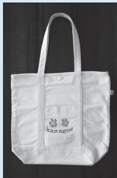
コットンタイプ 縦38×横42 ×幅13cm 400円