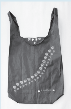
レジ袋タイプ 縦40×横35 ×幅11cm 400円