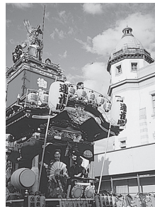
⑩ 連雀町(歴史文化伝承山車) 人形 大田道灌