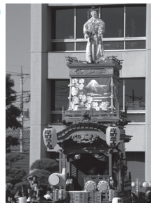
⑬ 岸町二丁目 人形 木花咲耶姫