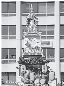
⑧ 松江町一丁目(市指定文化財) 人形 龍神