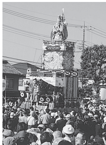
⑥ 元町二丁目(県指定文化財) 人形 山王