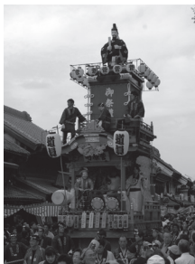
⑮ 菅原町 人形 菅原道真