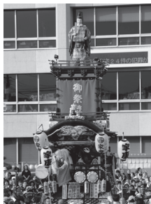
⑭ 脇田町 人形 徳川家康