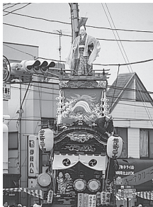
⑦ 松江町二丁目(県指定文化財) 人形 浦嶋太郎