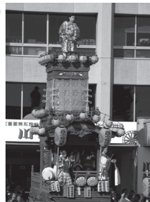
⑨ 西小仙波町(歴史文化伝承山車) 人形 素戔嗚尊