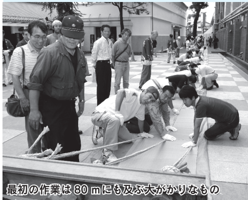
最初の作業は80mにも及ぶ夫がかりなもの

9月19日(土)、長寿を記念して、川合善明川越市長が2人の自宅を訪問し、記念品を手渡しました。「お2人とも、100歳を過ぎてこれだけ元気でいられるのはすごいですね。あやかりたいです」と川合市長。