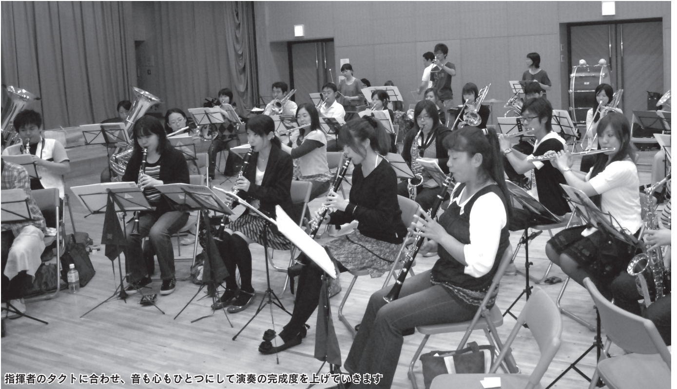
指揮者のタクトに合わせて、音も心もひとつにして演奏の完成度を上げていきます