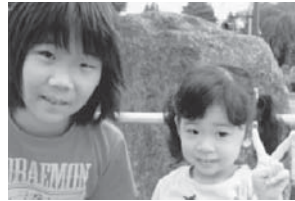
いとこのお姉ちゃん大好き♡