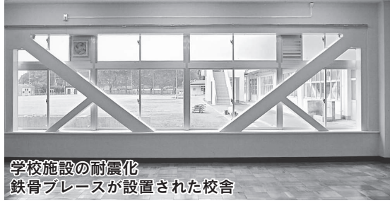
学校施設の耐震化 鉄骨ブレースが設置された校舎

市長 ：小中学校の校舎、体育館の耐震化工事は、どんなに急いでも平成27年までかかるという見通しでした。これを何とか平成24年度中には終えたいという考えで計画を組み、対応しています。