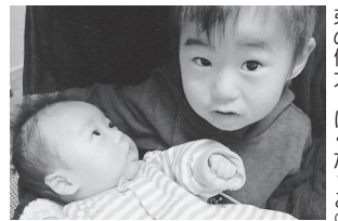
弟の健太、ぼへたっご