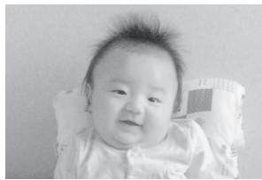
一人でおすわりできたよ