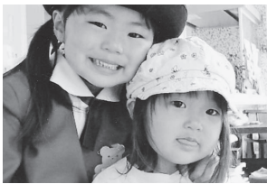
ネエネといつも一緒