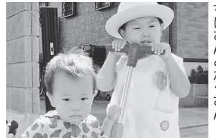
すけさんとかくせん