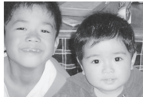
真吉兄ちゃん、だくいすき