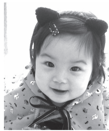
新沼ぞりちゃん (10か月/砂新田) 初ハロウィンで黒猫に変身☆