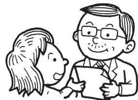
④かかりつけ医に診療情報提供書を申請