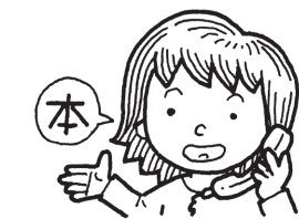
⑤施設に電話(本予約)