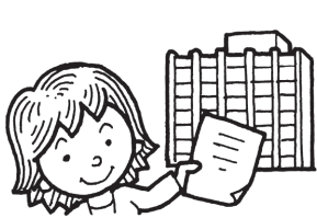
①保育課で利用登録