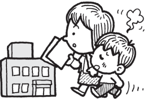
⑥利用申込書、診療情報提供書などを持参し施設へ