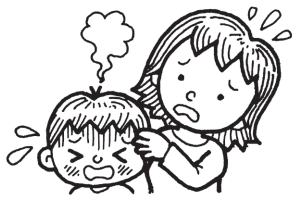
②子供が病気になった(右の①～④に当てはまる場合)