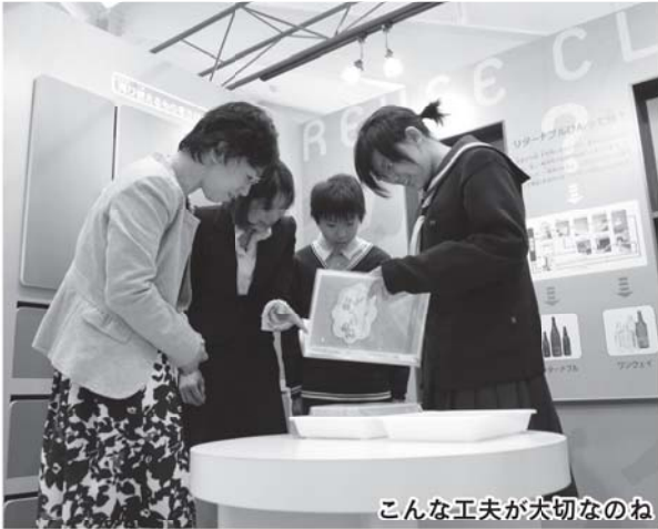
こんな工夫が大切なのね

3月28日、熱回収施設・リサイクル施設・草木類資源化施設など複数の施設からなる資源化センターが竣工しました。環境プラザ(つばさ館)では、古くなっても工夫しだいで使えるものを探したり、再利用できる瓶の種類を説明したりするコーナーで、楽しく学ぶ親子の姿が見られました。