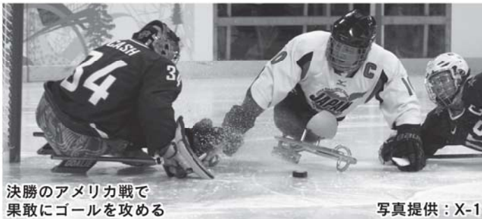
決勝のアメリカ戦で果敢にゴールを攻める