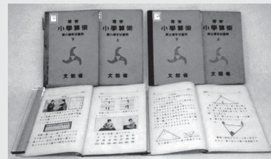
尋常小学校算術教科書(昭和14年ころ)

明治5年(1872年)に公布された学制により、日本で初めて行われた学校教育。現代に至るまで