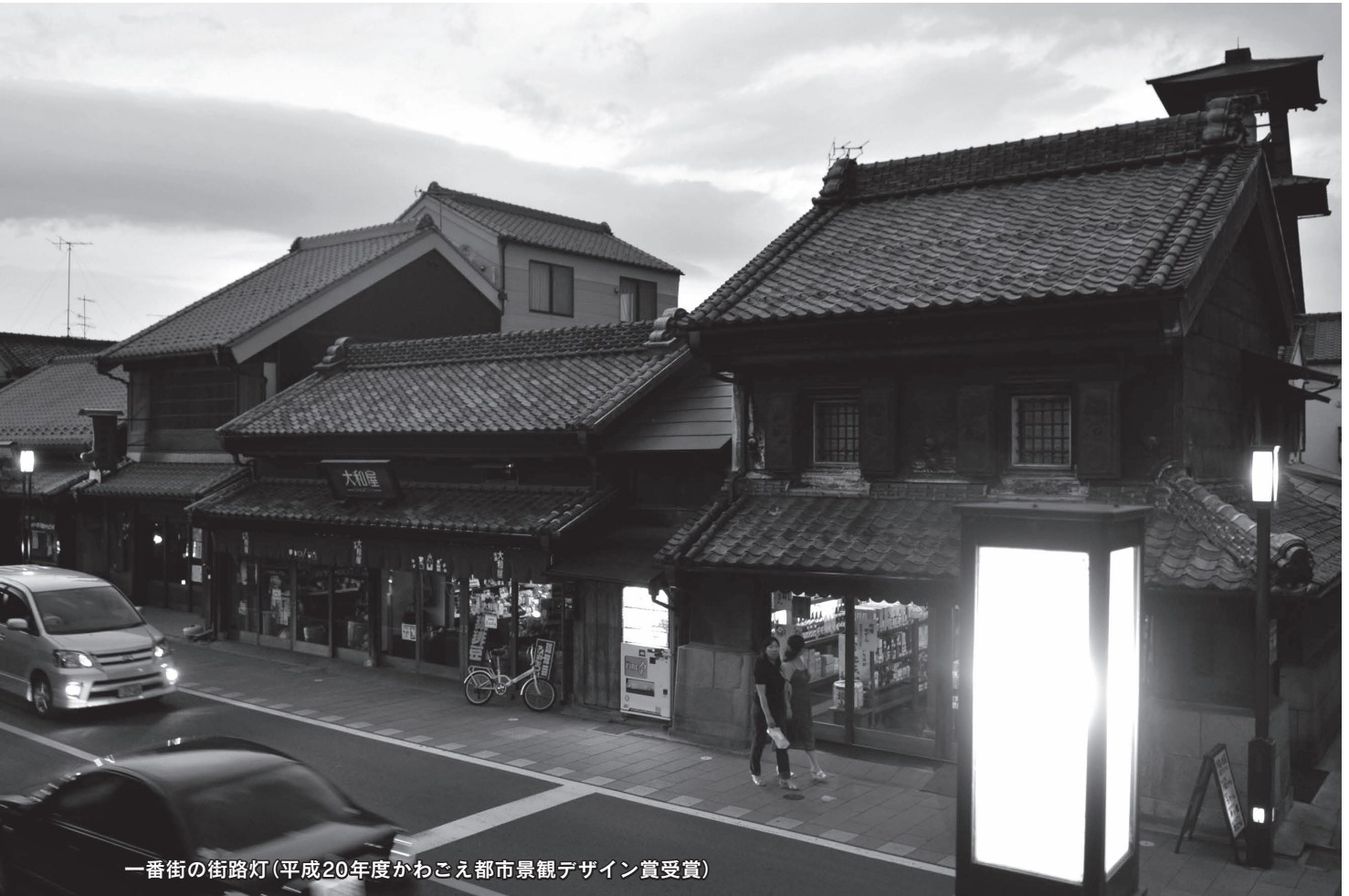
一番街の街路灯(平成20年度かわごえ都市景観デザイン賞受賞)