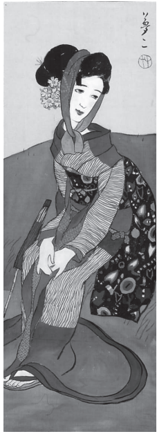
「草に憩う女」(大正初期)

②川越の大正建築見て歩き 日時…7月25日(日)、午前10時30分～午後4時 定員…先着20人 経費…100円(観覧料別途)