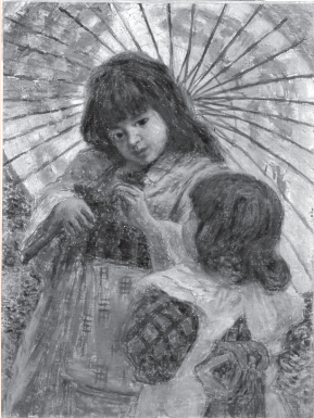
青木繁「二人の少女」 (明治42年)

笠間日動美術館所蔵の山岡コレクションを中心に、高橋由一、藤島武二などの、日本洋画草創期の秀作を紹介します。