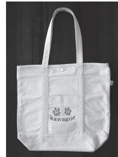
コットンタイプ・四百円 (縦38×横42×幅13cm)