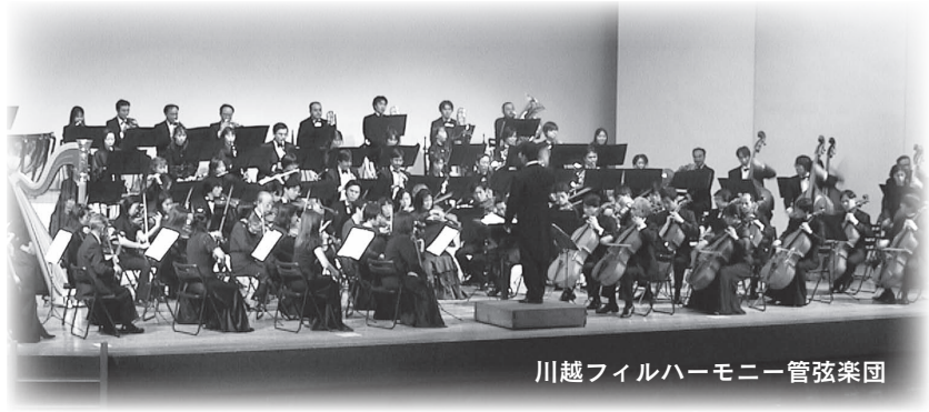
川越フィルハーモニー管弦楽団

市では4月から文化スポーツ部を設置し、市民の皆さんが文化芸術にふれあう機会を、より多く創出できるように努めています。その一環として「小江戸川越第九演奏会」を開催します。市民による市民のための演奏会とするため、合唱に参加する市民の皆さんを募集します。