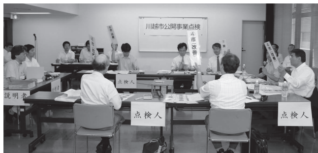
多数決で点検結果を決定している様子

検結果などを参考に、各事業の今後のあり方などを検討し、できるかぎり来年度以降の事業に生かしていきます。市の方針は、決まりしだい市ホームページなどでお知らせします。