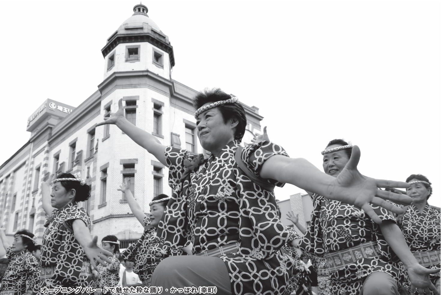
オープニングパレードで魅せた粋な踊り・かつぼれ(幸町)