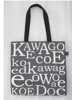
トートタイプ・六百円 (縦36×横33×幅15cm)