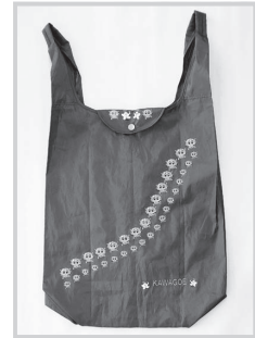
レジ袋タイプ・四百円 (縦40×横35×幅11cm)