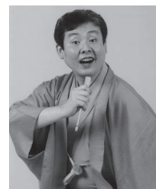
落語・柳家喬太郎