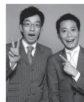
漫才・ロケット団