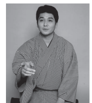
落語・三遊亭歌扇