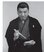
落語・入船亭扇遊