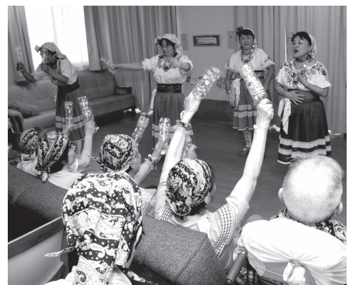
福祉施設でのボランティアの様子。リズムに合わせて、体が自然に動きます

大使館から本国でのイベント参加の案内を受け、8月23日から五日間行われた、第三十八回ブルガス民族舞踊フェスティバルに参加。はるばる日本からやって来