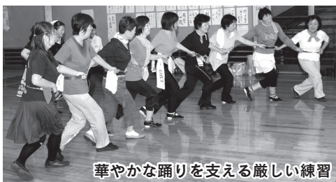
華やかな踊りを支える厳しい練習

老人ホームの訪問などでは、踊りの合間、すぐに息を整え、お年寄りとは談笑するメンバー。疲れた様子は