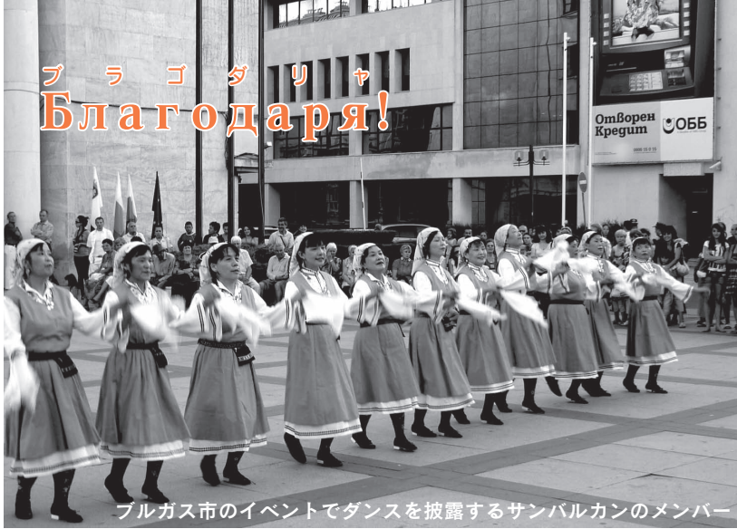
ブルガシ市のイベントでダンスを披露するサンバルカンのメンバー