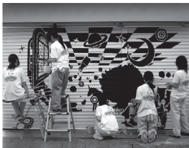
川越工業高校 の作品