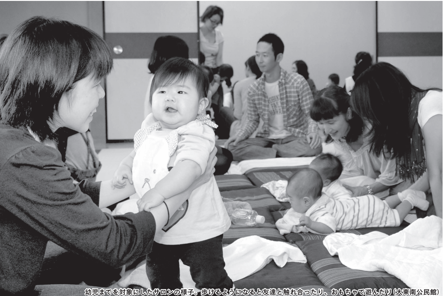
幼児までを対象にしたサロンの様子。歩けるようになると友達と触れ合ったり、おもちゃで遊んだり(大東南公民館)