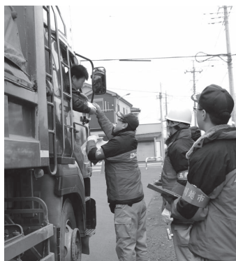
11月17日、国道254号で市内ですべて行われた路上調査。調査車両10台のうち不備があった5台に指導を行いました。

市では、日ごろから市内パトロールを行い、不法投棄等の防止に努めています。不法投棄等の監視に市民の皆さんのご協力をお願いします。