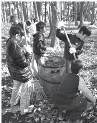
小学生も落ち葉掃きに挑戦