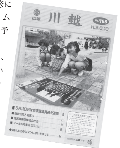
平成3年6月10日発行の広報川越の表紙写真で、タイムカプセルを紹介しました