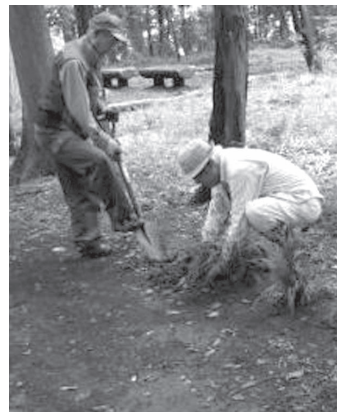
リユウノヒゲを植えて、散策路を整備しています

川越市には、蔵造りの町並みや時の鐘などの歴史的文化的遺産と共に、武蔵野の雑木林や河川などの優れた自然が多くあります。