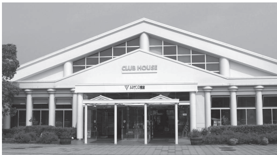
ルネサンス棚倉は、さまざまなスポーツを楽しむ、宿泊もできるリゾート施設です。

川越市の皆様、棚倉町は元氣です。ぜひ遊びに来て下さい。ゴルフで交流を深めましょう。また、ルネサンス棚倉では、川越市民の皆様特別プランを用意してお待ちしています。