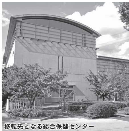
移転先となる総合保健センター

現在市立診療所で行っている一般の方や障害のある方への歯科診療は、来年4月から総合保健センターの一部を改修して行う予定です。市では、この施設が皆さんに親しまれるよう、名称を募集します。