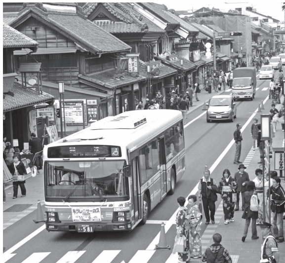
交通社会実験の様子(一方通行時)