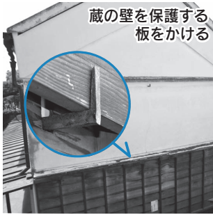
蔵の壁を保護する板をかける