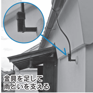
金具を足して雨どいを支える