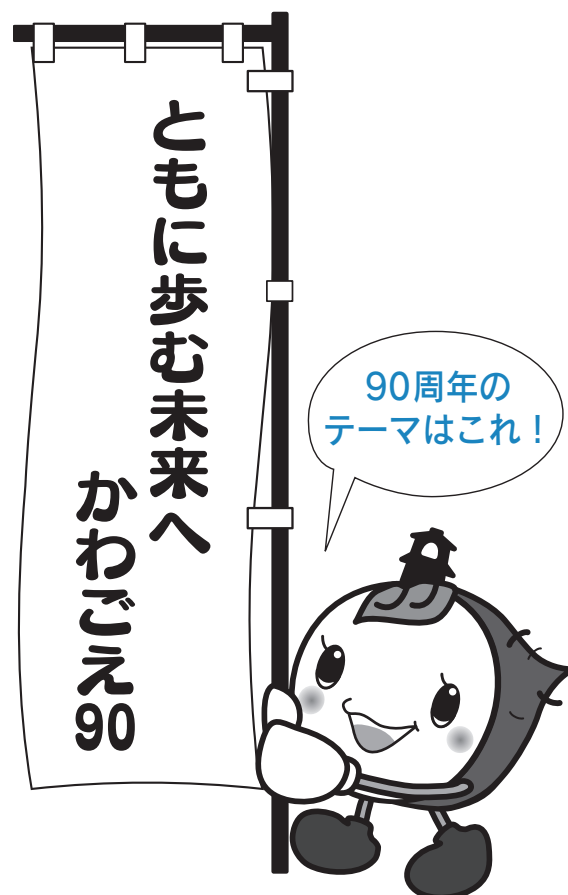
川越市マスコットキャラクター ときも