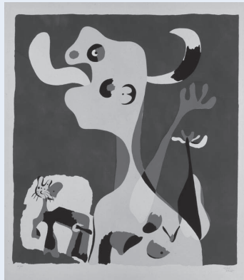
ジョアン・ミロ《月の前の女と犬》 1936年 © Successió Miró-Adagp, Paris & SPDA, Tokyo, 2011

20世紀を代表するスペインの巨匠としてピカソ、ダリと共に並び称されるジョアン・ミロ(1893-1983)。故郷カタルーニャの大地にインスピレーションの源泉を求め、鮮やかな色づかいと強烈な形で詩的な世界を繰り広げました。油彩をはじめ彫刻、版画、陶器、壁画、タペストリー、舞台装飾と幅広く手掛けたミロ。今回は版画145点を展示します。初めて制作した版画作品「一羽の小さなカササギがいた」から、晩年までの作品をお楽しみください。