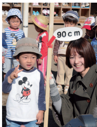
身長90cm (名細保育園) 身長90cmの たくさんの笑顔 に出会いまし た。