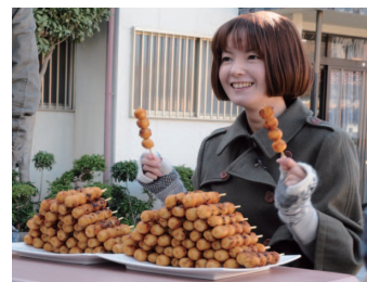
だんご90本(菓子屋横丁) 皿に並べると、大きな山が 2つできました。