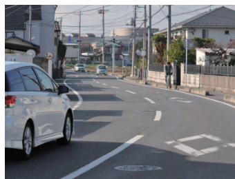
市道0090号線(鯨井) 起点・鯨井～終点・上戸間、 延長1,349.7m。近くにはメ ルト、名細保育園があります。