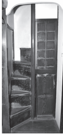
踏奥 段差は約30cm。 み面中央部分の 行きは約15cm。

建物保護のため、ふだんは見ることだけしかできないこの階段も、資料館ガイドの時は体験ができます。一体、何のために作られたのかを想像しながら、階段を降りてみてはいかがですか。