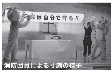
消防団員による寸劇の様子

また、寸劇などにより火事が起きたときの対応の仕方などを子どもたちに伝える活動も行っています。