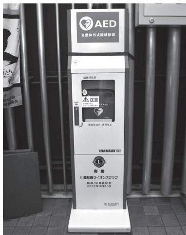
市役所1階ロビーのAED

市では、市民や観光客の皆さんの生命の安全を確保するため、平成24年2月1日現在、178台のAEDを市の公共施設に設置しています。AEDを設置している施設には、入口など見やすい場所にAEDマークを表示しています。